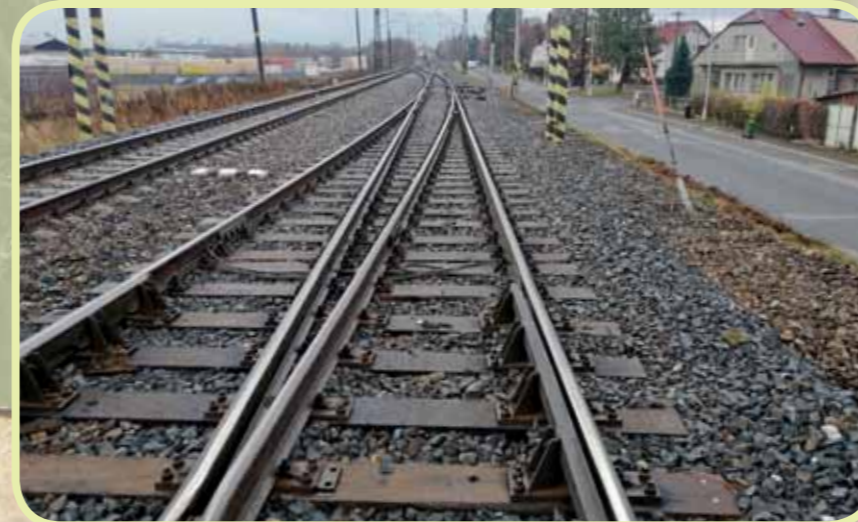
Oprava vjezdových výhybek v Čáslavi během 56 hodin