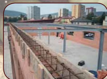
Stavba nové skladově-administrativní budovy v areálu společnosti N+N