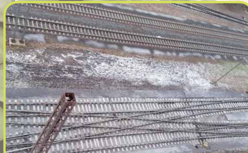
Rekonstrukce výhybek a kolejí v žst. Kolín