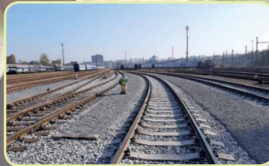
Oprava kolejí v komplexu odstavného nádraží Praha Jih