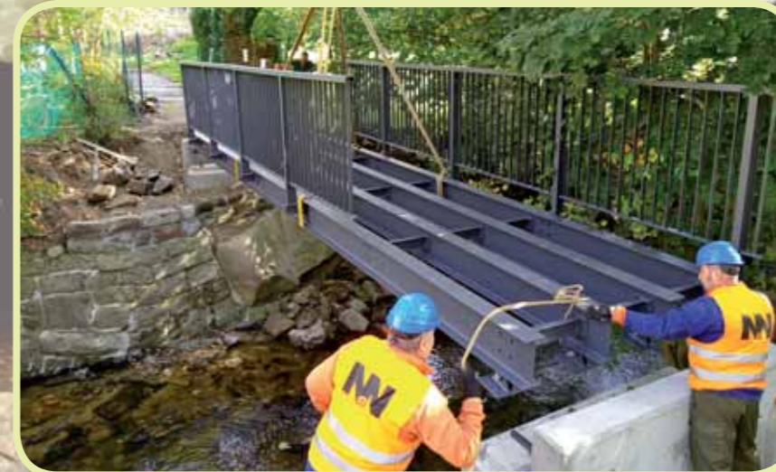
Rekonstrukce lávky v Jablonci nad Nisou