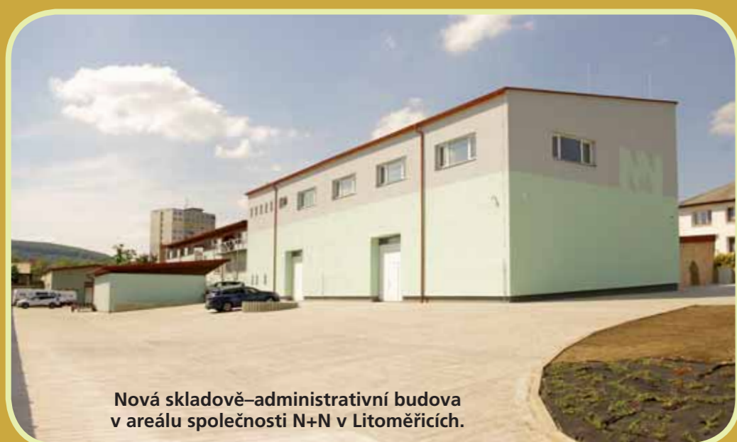
Nová skladově-administrativní budova v areálu společnosti N+N v Litoměřicích.